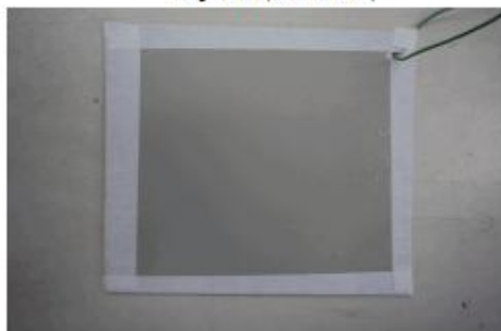
Fotografia nº 1 (Antes do ensaio)