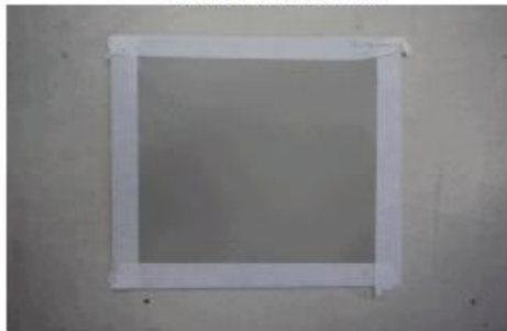
Fotografia nº 1 (Antes do ensaio)

Os resultados apresentados no presente documento referem-se exclusivamente à(s) amostra(s) analisada(s). A reprodução deste documento somente poderá ser feita na íntegra e sua utilização para fins promocionais depende de aprovação prévia.